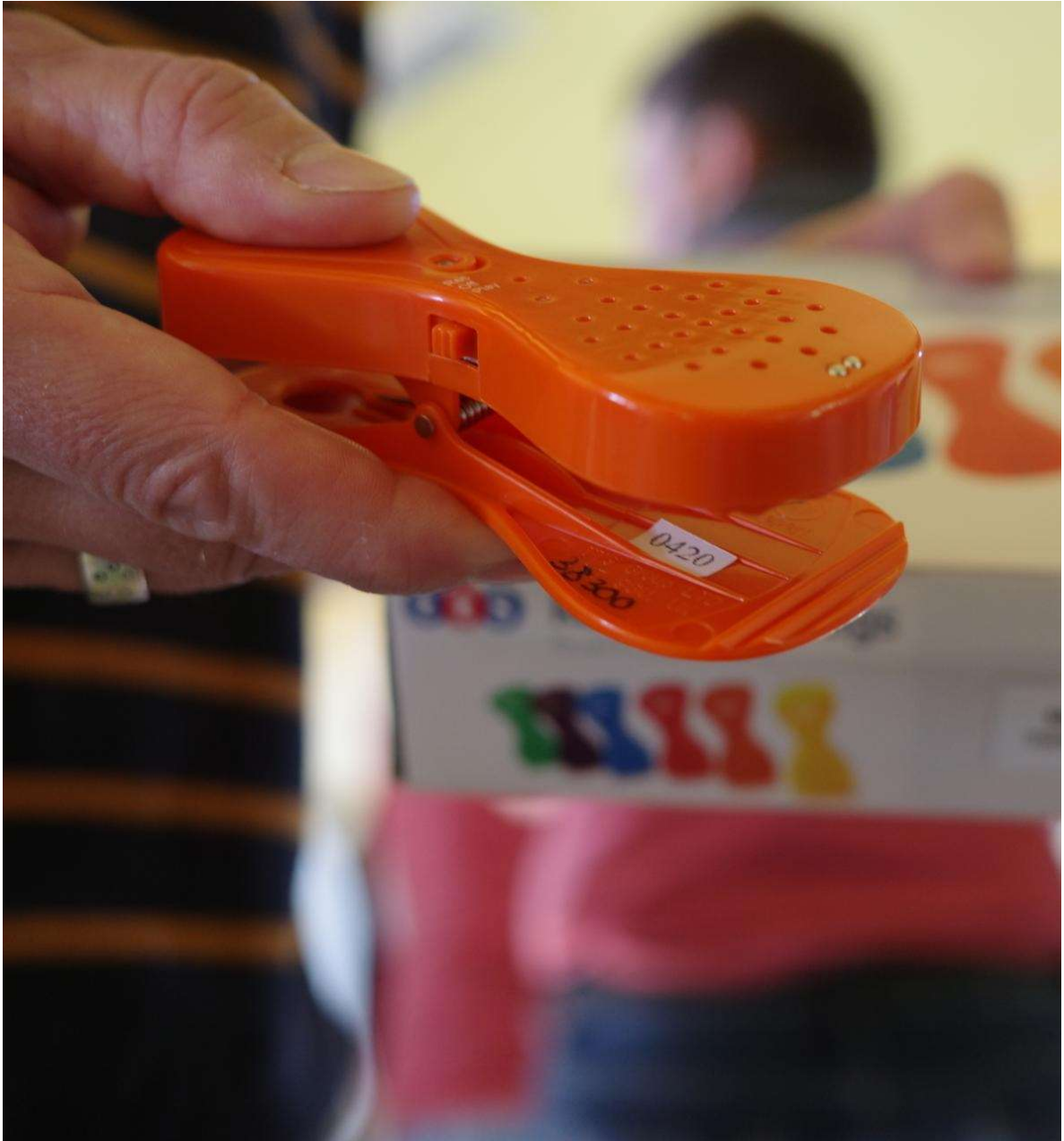
Forum des savoirs – Maternelles – Évreux Simon Lenormand