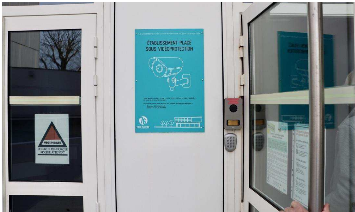
Le dispositif de vidéoprotection a été financé en totalité par le Département de la Seine-Maritime.