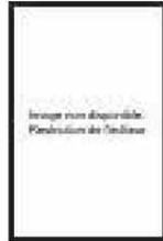
PIERRE OUZOULIAS Sénateur PCF des Hauts-de-Seine

Nombre d'établissements privés sont financés à hauteur de 73% par la puissance publique. L'enseignement catholique est conscient que des efforts sont attendus de son côté.