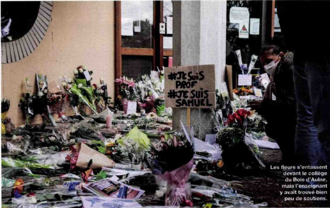
Les fleurs s'entassent devant le collège du Bois d'Aulne, mais l'enseignant y avait trouvé bien peu de soutiens.