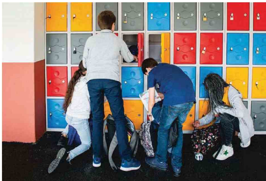
Elèves du collège privé Saint-Germain-de-Charonne - La Salle (Paris 20').

“ON DIT PAP SUR UN SIÈGE ÉJECTABLE. EN AFFIRMANT UNE IDENTITÉ POLITIQUE FORTE, IL S’ACHÈTERAIT UNE ASSURANCE-VIE.”