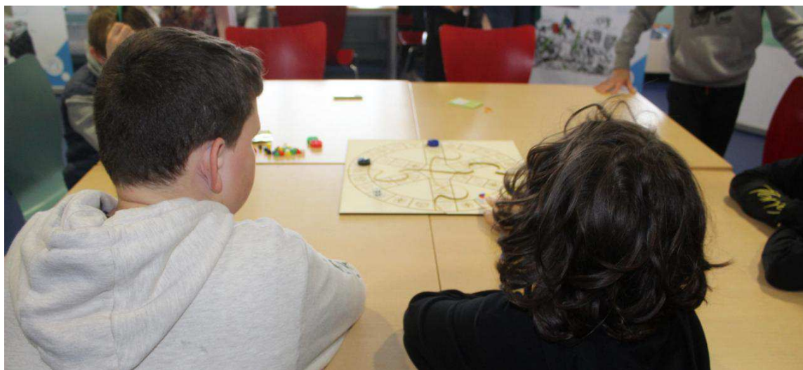
Collégiens et écoliers ont testé les jeux qu'ils ont créés. FS