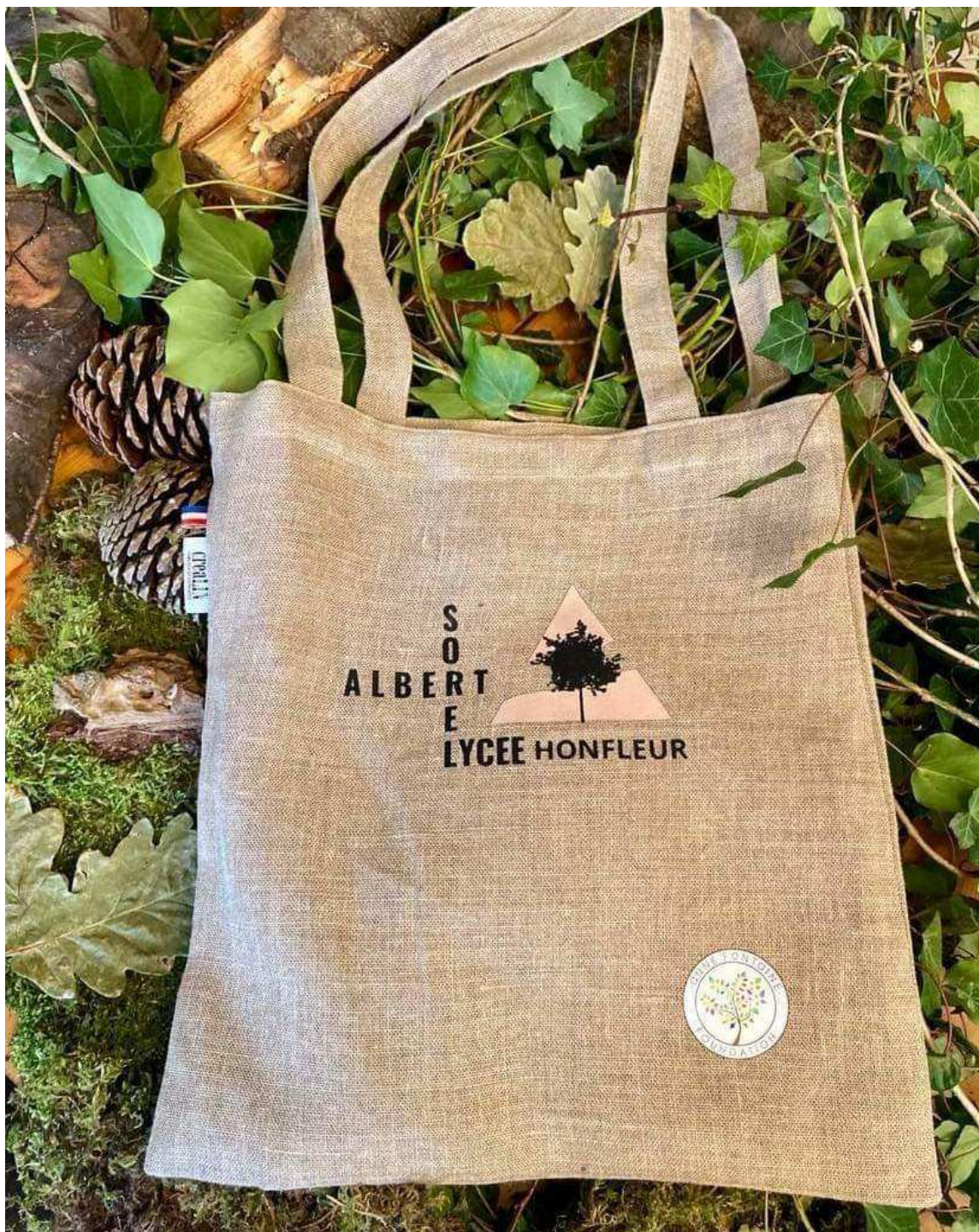
Le tote bag, au logo du lycée.