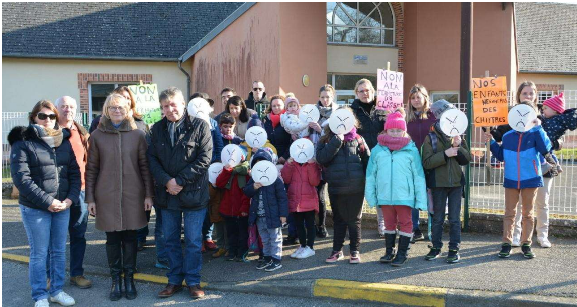
Judi, parents d'élèves, enfants et élus se sont mobilisés devant l'école pour protester contre l'annonce de la fermeture envisagée d'une classe Le Perche