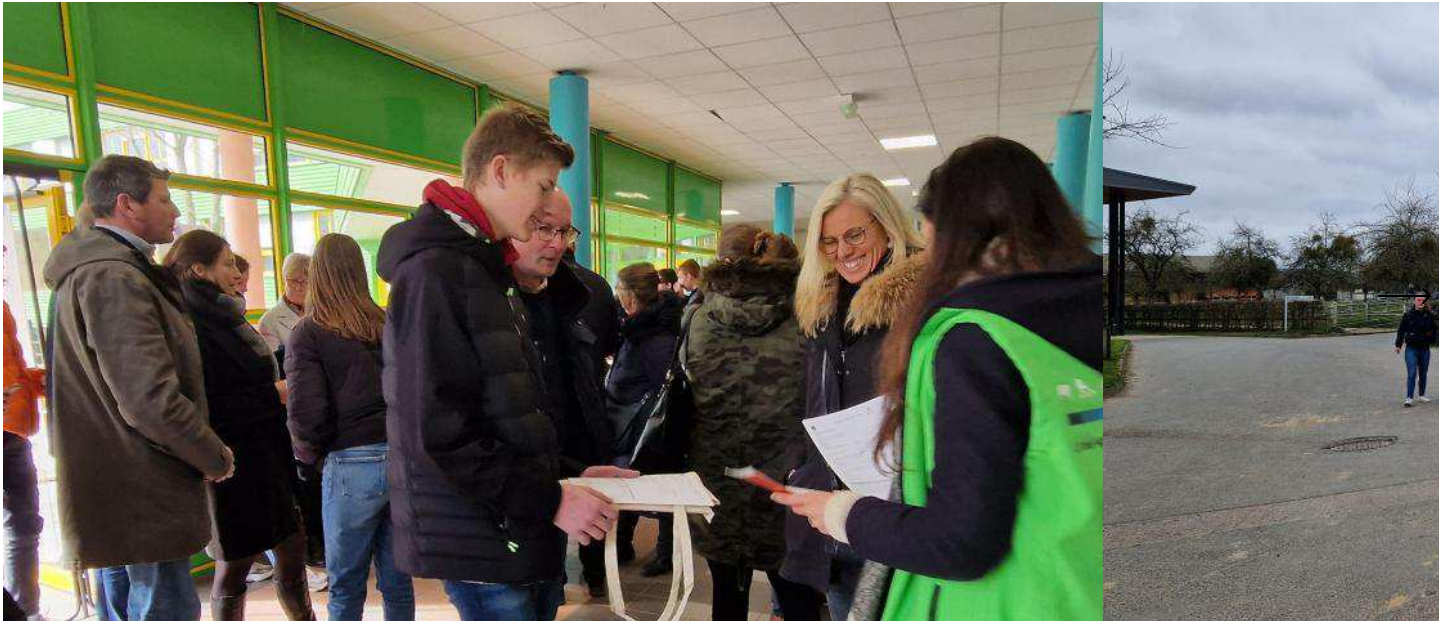
De nombreux futurs élèves et leurs familles ont été accueillis lors de la journée portes ouvertes du samedi 4 mars 2023 au lycée agricole d'Yvetot

La deuxième journée portes ouvertes de l'année 2023 au lycée agricole d'Yvetot samedi 4 mars 2023 a été de nouveau, comme en janvier, très suivie par les jeunes et leurs familles. Avec des idées en tête bien précises pour leur avenir.