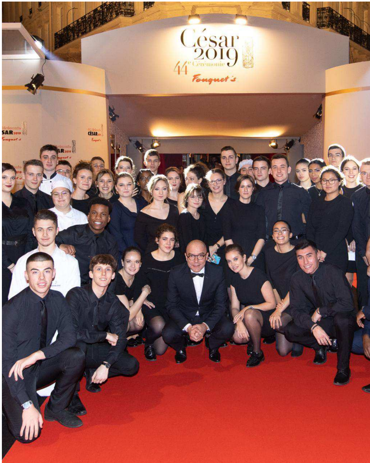
Lors des Césars 2019, près de 50 élèves du lycée Jean-Baptiste Décrétot avaient servi les stars au Fouquet's. Emmanuel Dal Fabbro - archive