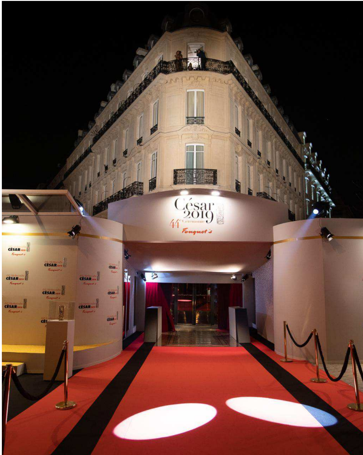
PARIS - LOUVIERS - César 2019 - les élèves du lycée Jean-Baptiste Décrétot ont servi les stars aux César. Emmanuel Dal Fabbro