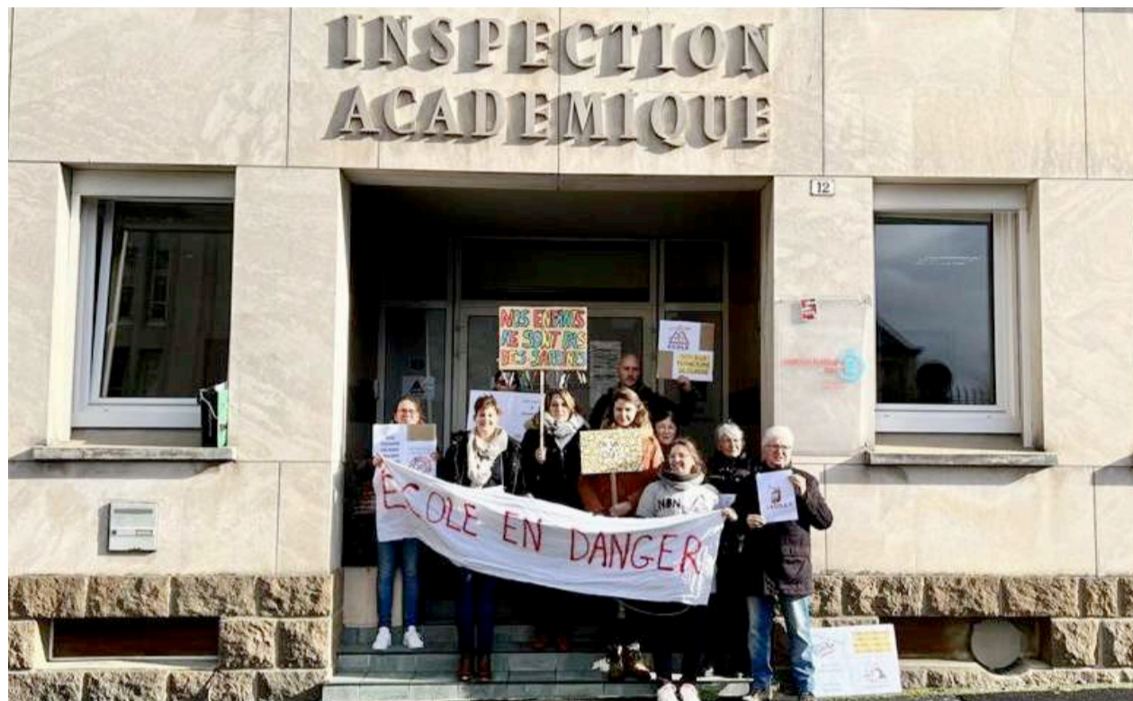
➔ Les parents d'élèves, comme les élus, refusent cette fermeture de classe au sein du RPI.

S'ils entendent le discours de l'inspecteur, pour ces élus, 24 élèves par classe, « c'est trop pour apprendre correctement ». « Avec des élèves en