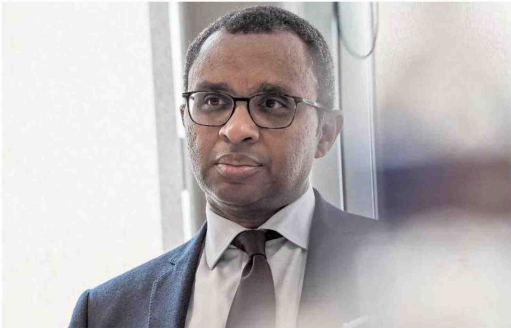
Le ministre de l'Éducation nationale, Pap Ndiaye, en novembre 2022.