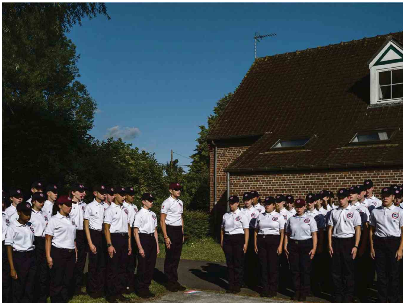
A Morbecque (Nord), en juin 2019 lors d'une session du service national