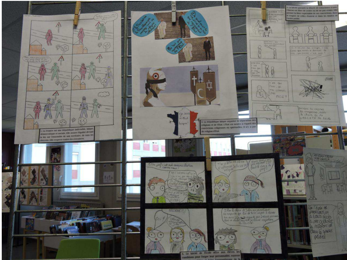
Une expo issue d'un gros travail.