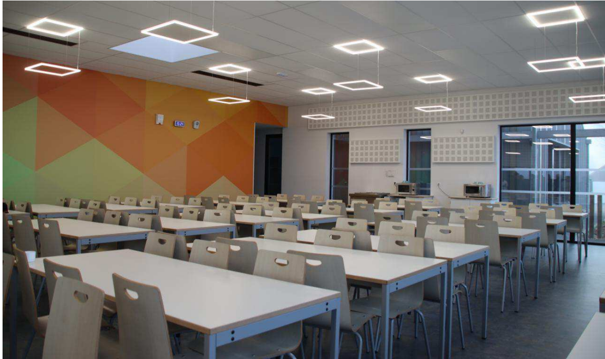
La nouvelle salle de la cantine du collège. Yann Rivallan