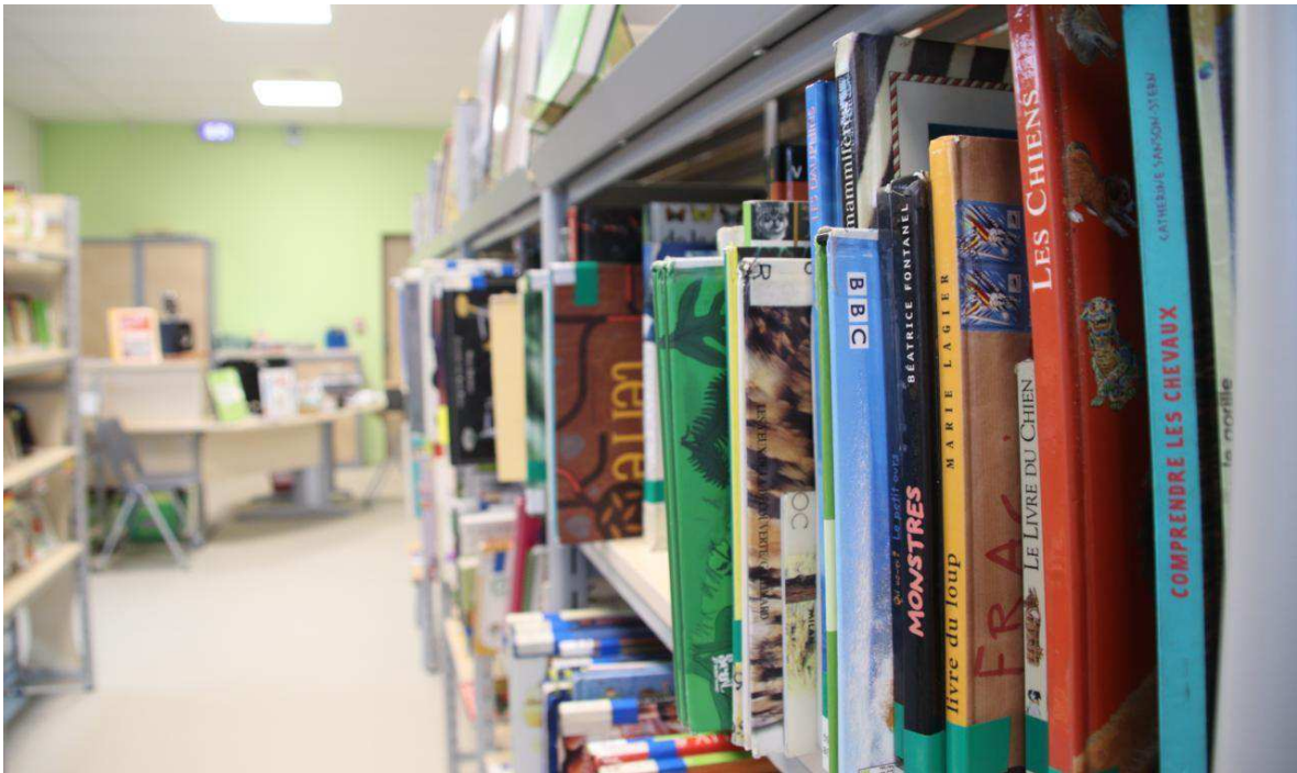
Le CDI a été déménagé dans l'ancien réfectoire. Il est désormais bien plus grand. Yann Rivallan