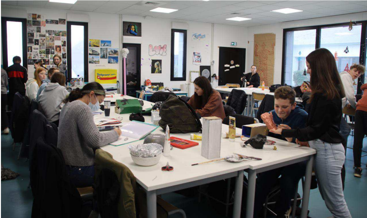
Des élèves en plein cours d'arts plastiques. Yann Rivallan