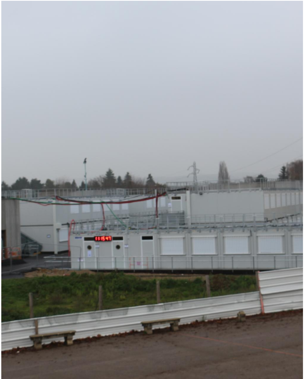
Collège Signoret Le Val d'Hazey