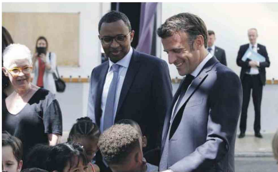
A Marseille, le 2 juin, Emmanuel Macron a salué « le destin d'excellence » de son nouveau ministre, Pap Ndiaye .

« Avoir l'impression d'avoir donné les clés d'une centrale nucléaire à un stagiaire, ça va un moment. Blanquer et son équipe étaient, eux, préparés comme des athlètes avant les JO »