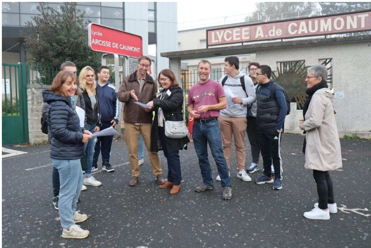
Mobilisation devant le lycée Arcisse-de-Caumont à Bayeux.

À 9 h, les enseignants ont pris la direction de Caen , pour le rassemblement Rectorat, et une délégation sera reçue à 14 h 30. Tandis que les militants de l'interprofession CGT se sont rendus à Deauville , chez Jacomo, pour soutenir la grève du personnel.