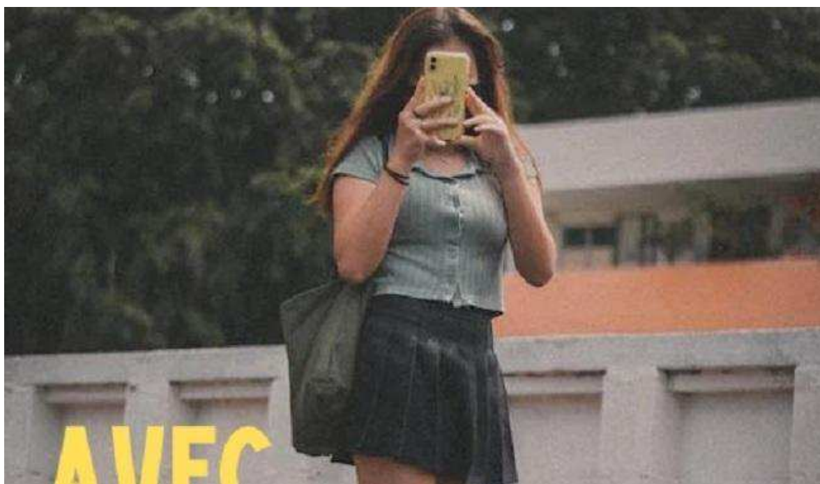
L'affiche du spectacle qui sera joué devant les collégiens