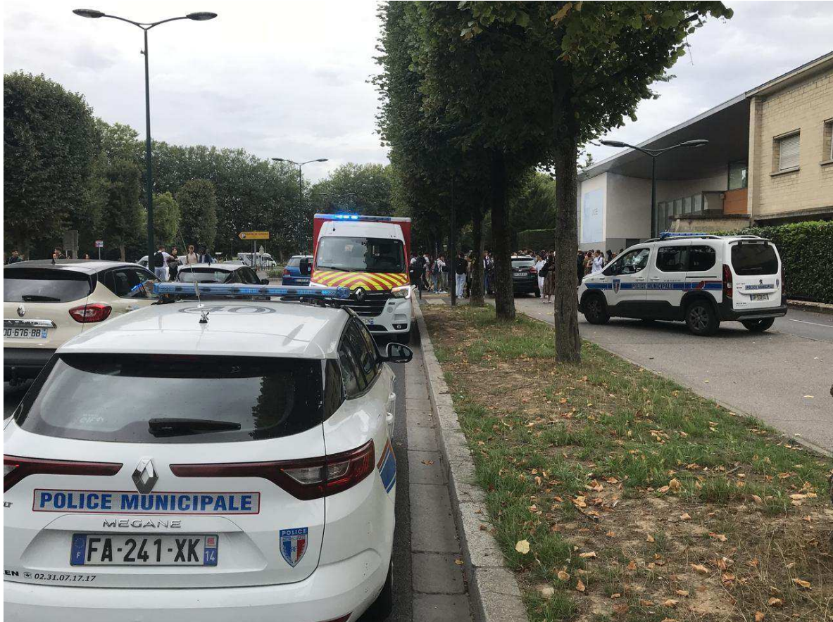
Des inspections ont eu lieu par la police au quatrième étage.

Aucun autre élève n'a été blessé. Les élèves de la classe en question ont été pris en charge par des médecins psychologiques peu de temps après l'agression. La police a annoncé à 12 h 30 qu'ils pouvaient retourner en cours, bien que de nombreux professeurs aient choisi davantage la discussion avec leurs groupes. Des élèves de seconde 1 devaient aussi être entendus par des enquêteurs.