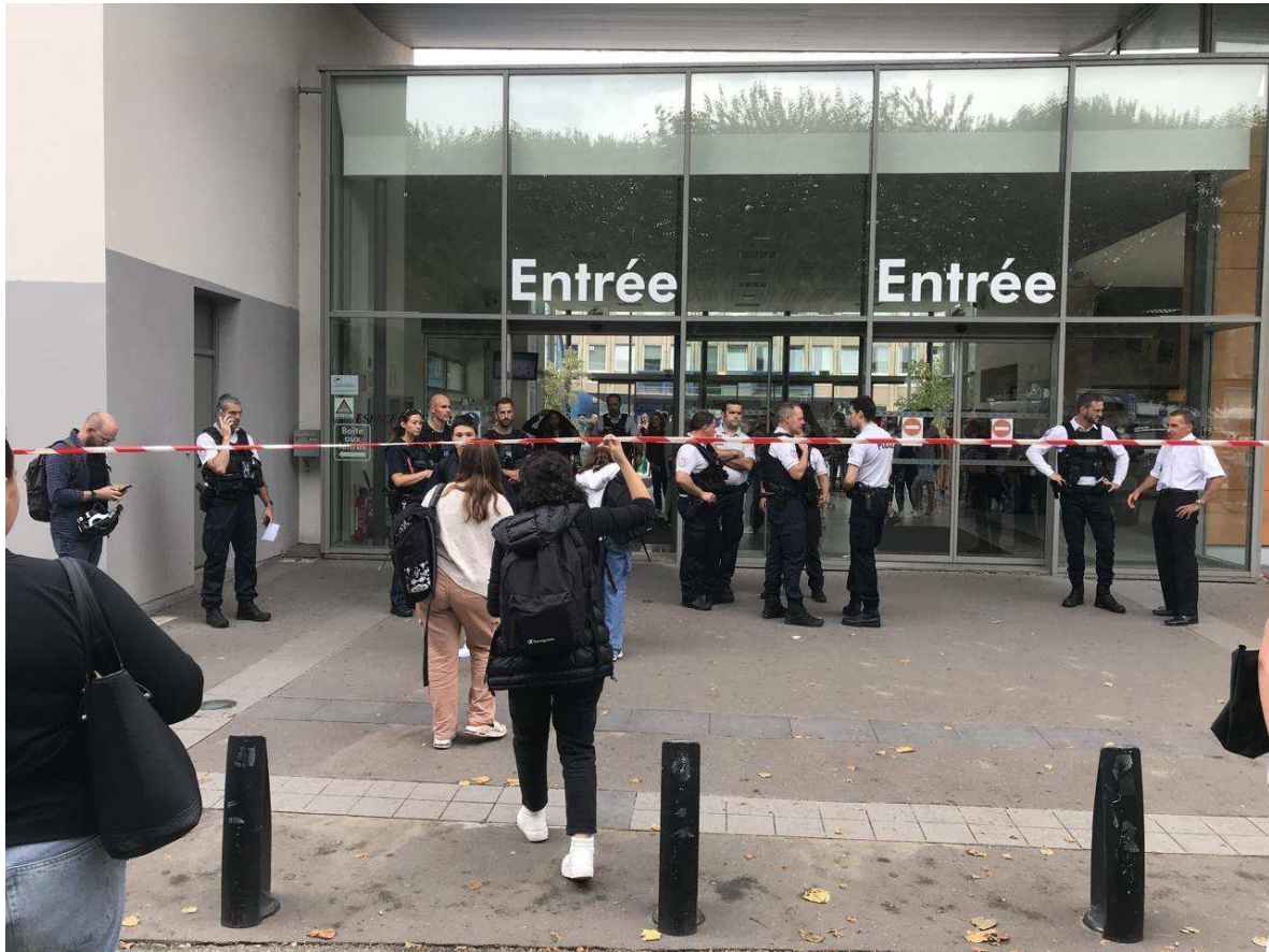
L'agression se serait produite au quatrième étage du lycée Malherbe. Ouest-France