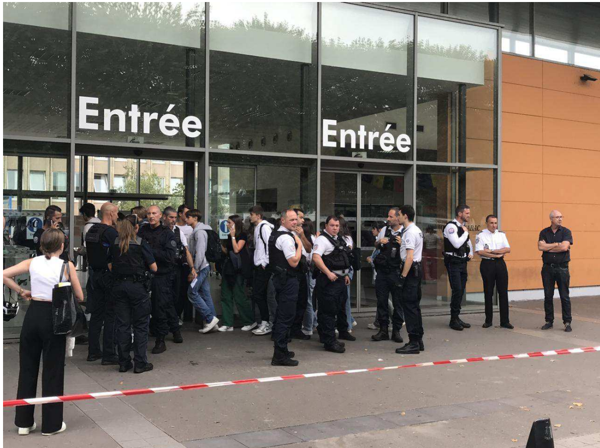
Un large attroupement s'est formé devant le lycée.