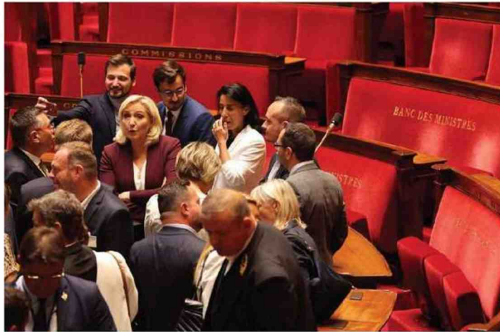
Paris (VI*), Palais-Bourbon, le 22 Juin. Face à l'arrivée de 89 députés RN à l'Assemblée, Pap Ndiaye déplore l'« effritement du front républicain ».