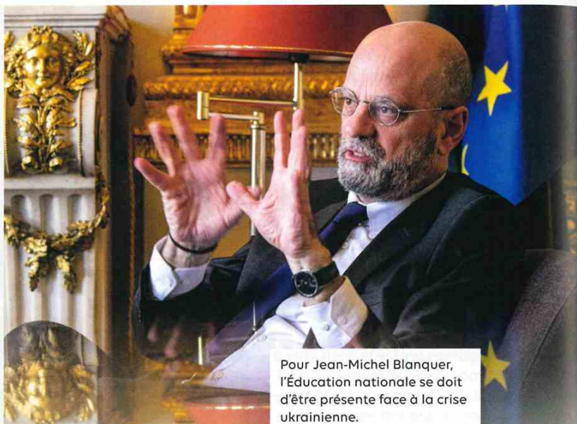
Pour Jean-Michel Blanquer, l'Éducation nationale se doit d'être présente face à la crise ukrainienne.

inscrite dès le départ dans ma mission : rester cinq ans en poste, pour pouvoir améliorer notre système éducatif dans le long terme, c'était l'ambition que m'avait fixée le président de la République. Et j'ai eu la chance de bénéficier de sa confiance pendant ces cinq années, en restant fidèle à nos deux objectifs principaux : augmenter le niveau