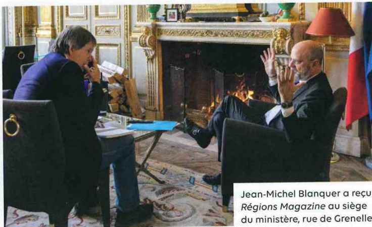
Jean-Michel Blanquer a reçu Régions Magazine au siège du ministère, rue de Grenelle.

« Sur la "carte-cible" de l'apprentissage, nous sommes ouverts aux propositions des Régions... »