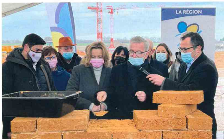
Le 11 décembre dernier, pose de la première botte de paille et de brique de terre cuite au futur lycée de Hanches (Eure-et-Loir), bâtiment à la pointe sur le plan environnemental, et qui accueillera 1.200 élèves en 2023.

S'appuyant sur leurs compétences dans le développement économique, elles ont également créé des commissions permettant aux acteurs du monde de l'entreprise de préciser leurs besoins de demain, afin de les mettre en adéquation avec certaines filières d'enseignement. Dans ces conditions, il aurait été plus qu'utile d'associer les Régions à la réflexion sur la réforme du lycée. Cela n'a pas été le cas : au contraire cette réforme n'a pas été coconstruite, n'a pas été concertée en amont. En revanche, suite à nos demandes réitérées, nous sommes bien informés de sa mise en œuvre par la commission de suivi qu'a créée le Ministère. Ce manque de concertation, on le retrouve dans la réforme de l'enseignement des mathématiques, que l'on a voulu réduire à sa plus simple expression, voire supprimer complètement dans certaines filières. Nous n'avons jamais eu autant besoin d'ingénieurs, de techniciens, de spécialistes du numérique, et l'on réduit l'enseignement des maths comme une peau de chagrin !