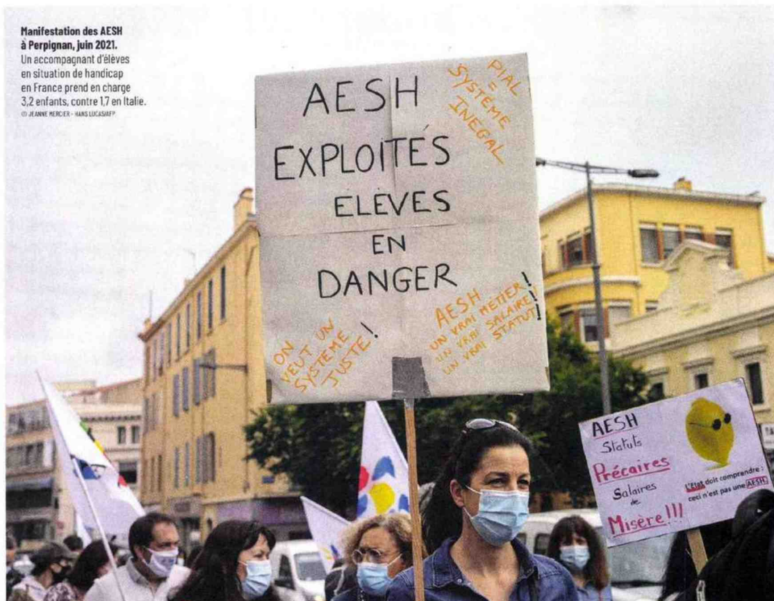
Manifestation des AESH à Perpignan, juin 2021. Un accompagnant d'élèves en situation de handicap en France prend en charge 3,2 enfants, contre 1,7 en Italie.

l'élève, mais aussi ses camarades ». Un sentiment d'échec que les professeurs cachent, par pudeur, observe Guislaine David : « Tirailés entre la volonté de bien faire et le constat de faillite, ils sont renvoyés à leur échec et en endossent la responsabilité, alors que c'est celle de l'institution, qui n'offre pas les moyens d'inclure dans de bonnes conditions. »