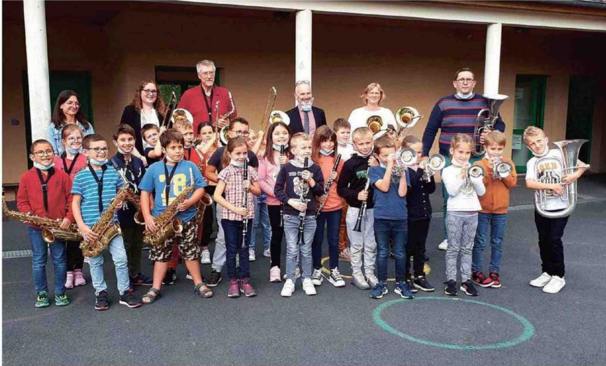
La ville de Carentan-les-Marais (Manche) a bien avancé sur le TER. Un orchestre à l'école a aussi débuté, encadré par le chef de l'harmonie municipale.