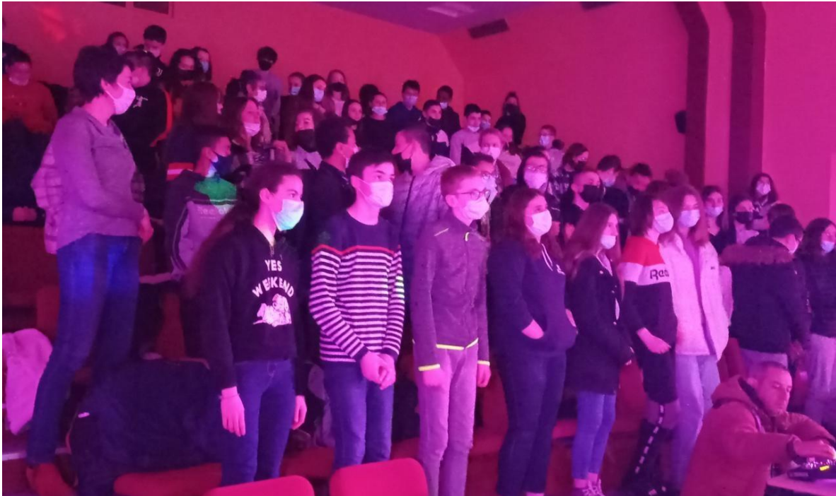
Les élèves ont apprécié le spectacle.

A ce jour plus, de 66 000 élèves ont bénéficié de ce programme plébiscité par les établissements partenaires.