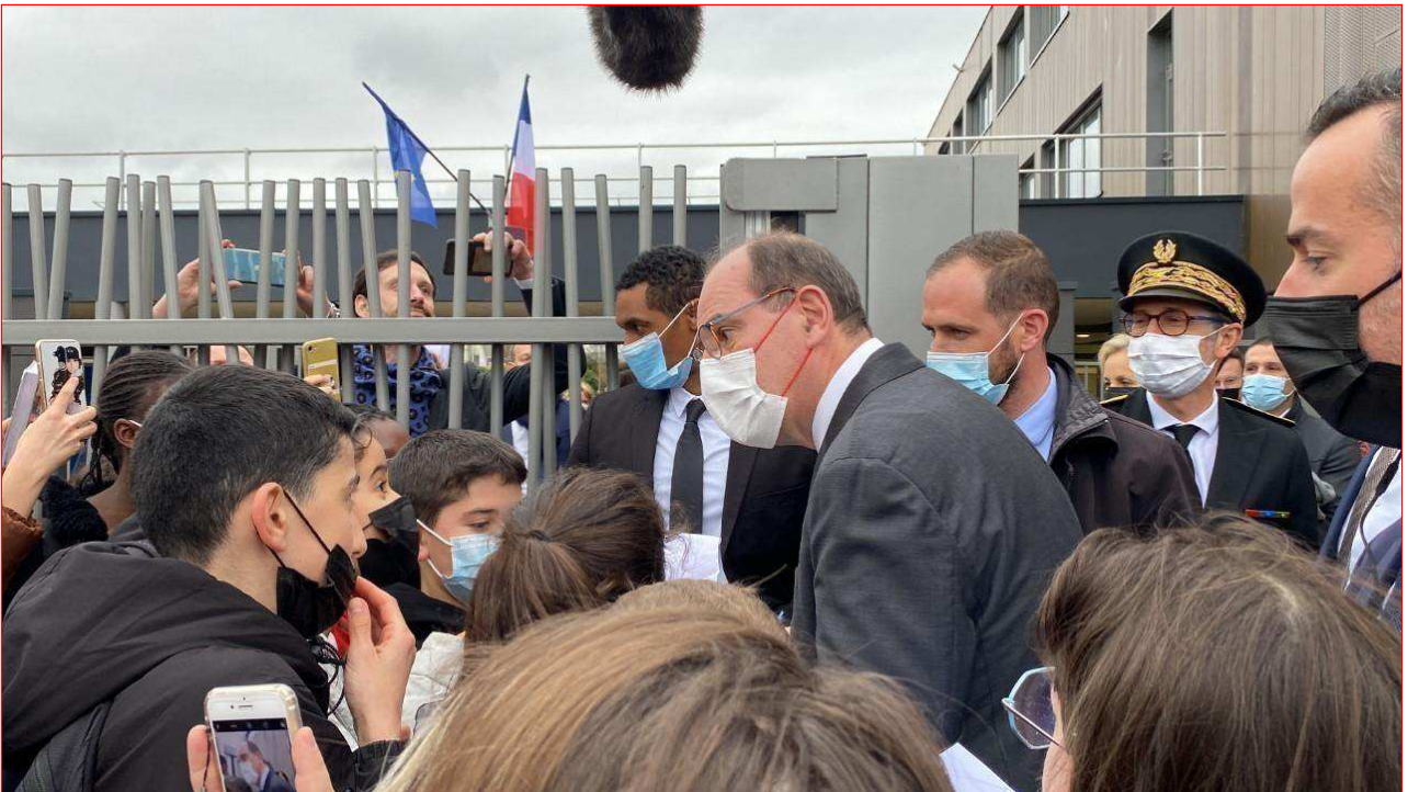
Jean Castex s'est pris un bain de foule devant le collège où il a même signé des autographes !