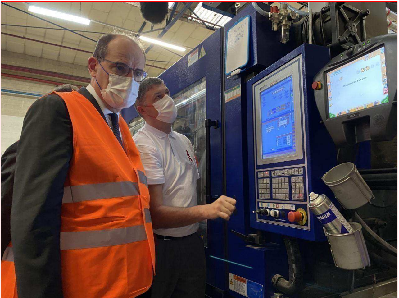
Le Premier ministre a visité l'usine Rowenta.