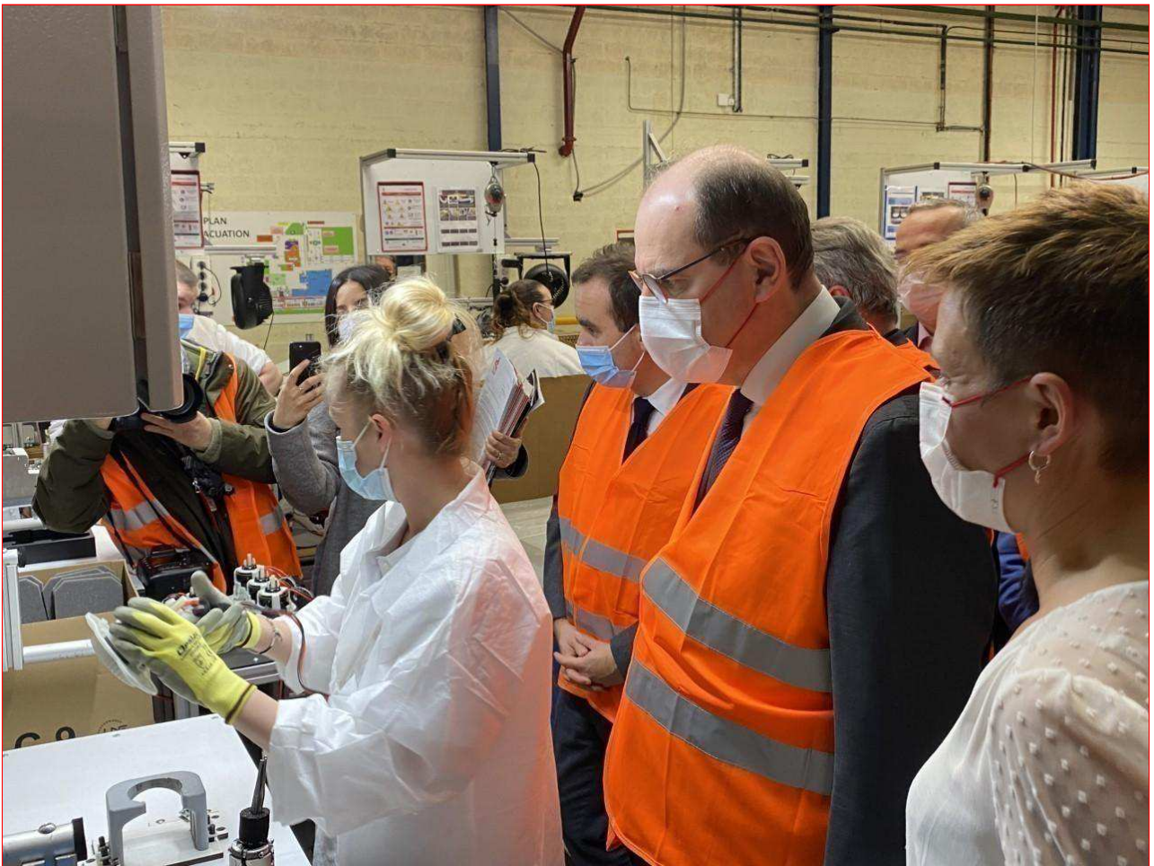
Jean Castex à la rencontre des salariés de l'entreprise Rowenta.