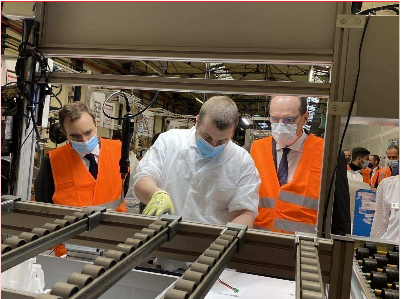
Jean Castex en pleine observation.