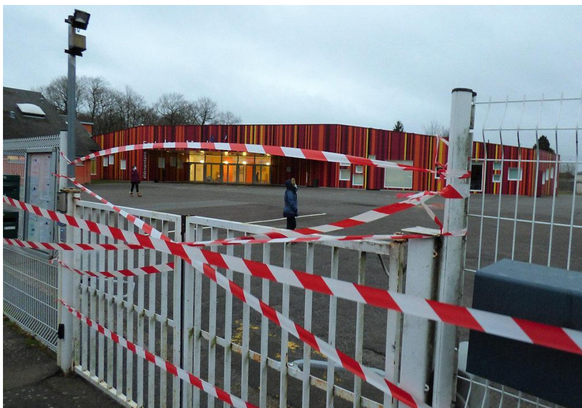
8 h 30 : les grilles d'entrée de l'École Jean-Moulin sont fermées, en signe de protestation contre le projet de carte scolaire.