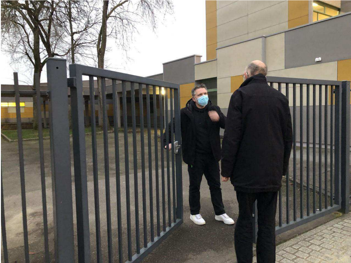
Le directeur de l'école Jules Verne accueille les parents ce jeudi matin. Ouest-France