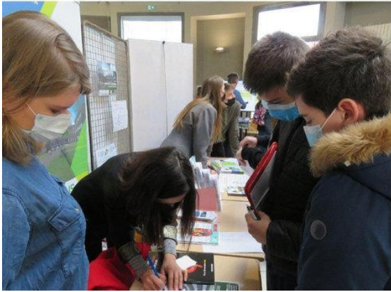
Lycéens et enseignants ont pu échanger avec les collégiens.