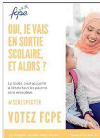
Associations de parents d'élèves, sites web, publications diverses, l'institution que représente l'école est infiltrée de toutes parts par les militants woke et islamogauchistes.

toire. SOS Homophobie est agréé par l'Éducation nationale, comme le Planning familial, qui fait lui aussi de la « lutte contre les stéréotypes de genre » une priorité. Ou comme Contact, dont le représentant a expliqué lors d'une table ronde organisée par l'académie de Dijon qu'il concevait ses interventions « avec les services de vie