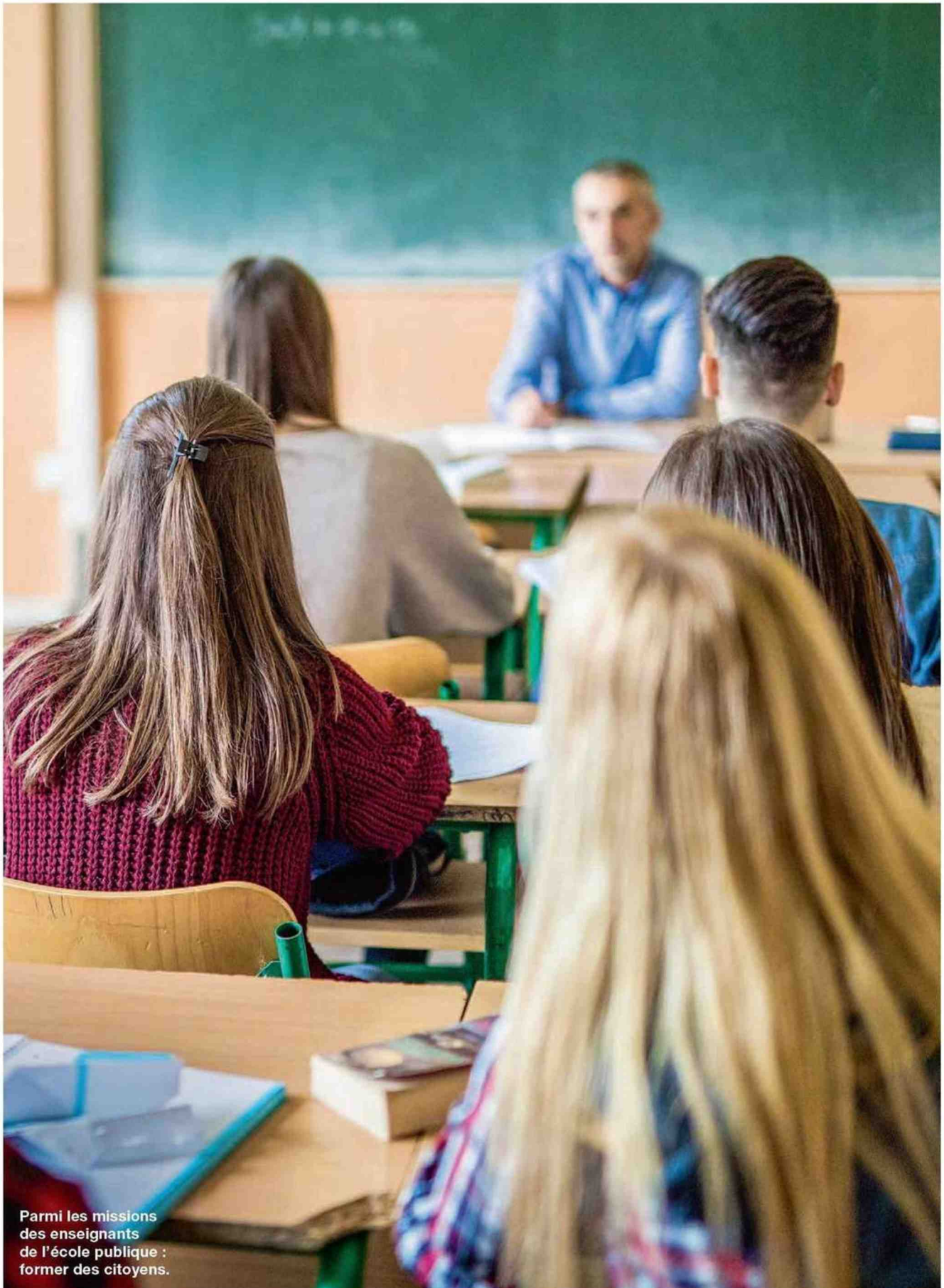
Parmi les missions des enseignants de l'école publique : former des citoyens.