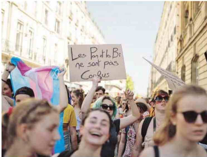
Un slogan pansexuel brandi par des manifestants lors de la Marche des fiertés, le 1 er juin 2019, à Nantes.