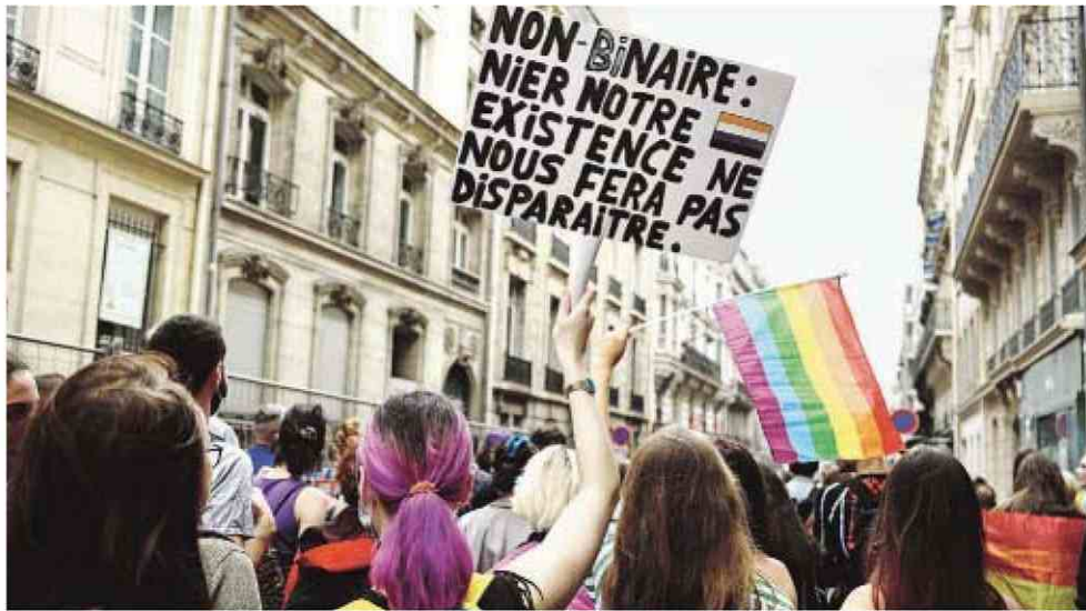
Marche des fiertés, le 4 juillet 2020, à Paris.