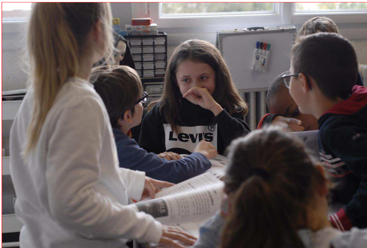
Les élèves de l'école Jeanne-d'Arc, à Argentan (Orne), travaillent sur leur journal.

Ils sont déjà en train de réfléchir à leurs prochains sujets. -