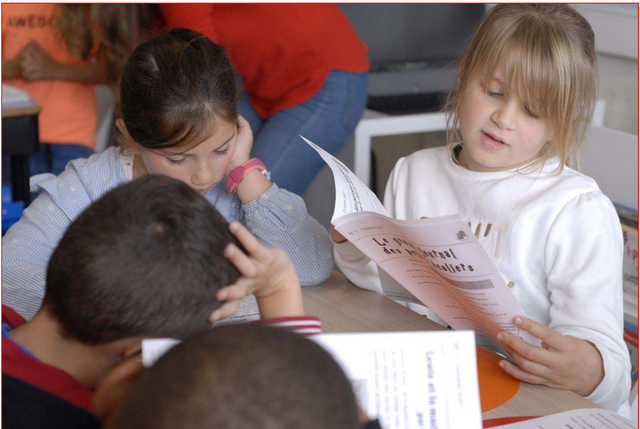
Les élèves de l'école Jeanne-d'Arc, à Argentan (Orne), travaillent sur leur journal.