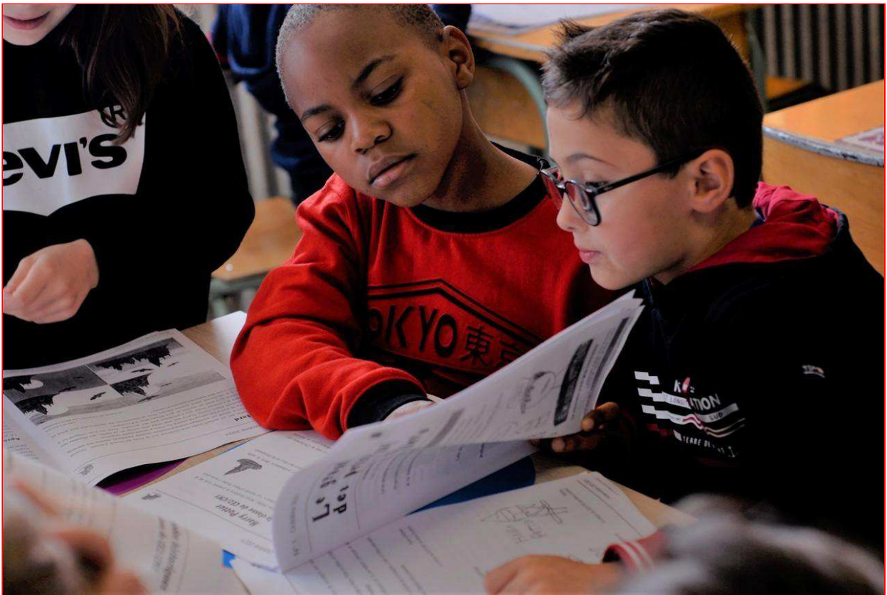
Les élèves de l'école Jeanne-d'Arc, à Argentan (Orne), travaillent sur leur journal.