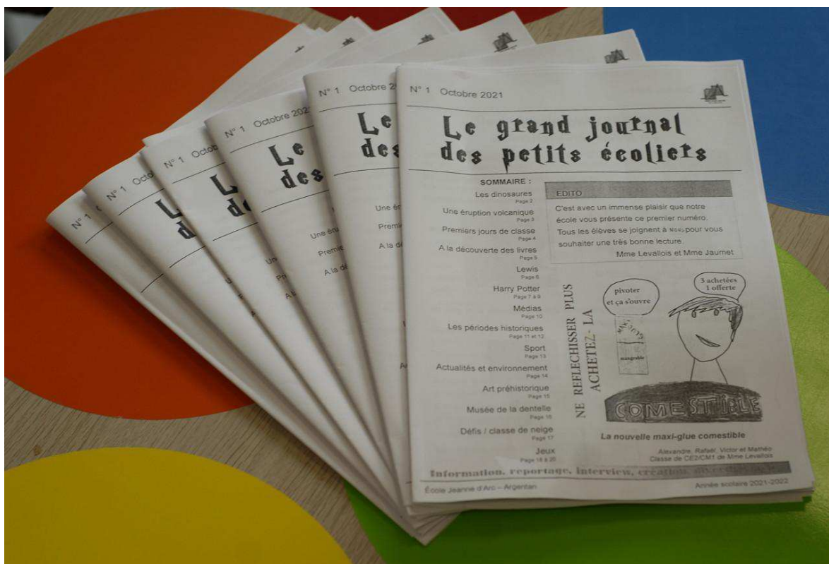
Le Grand journal des petits écoliers, créé par les élèves de l'école Jeanne-d'Arc, à Argentan (Orne).