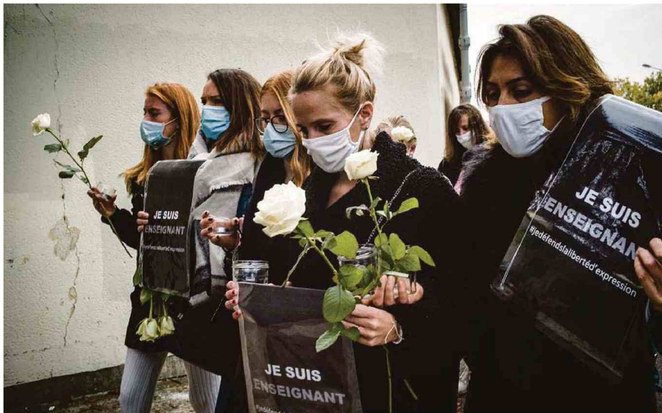
A Conflans- Sainte- Honorine, le 17 octobre 2020, le lendemain de la décapitation de Samuel Paty.