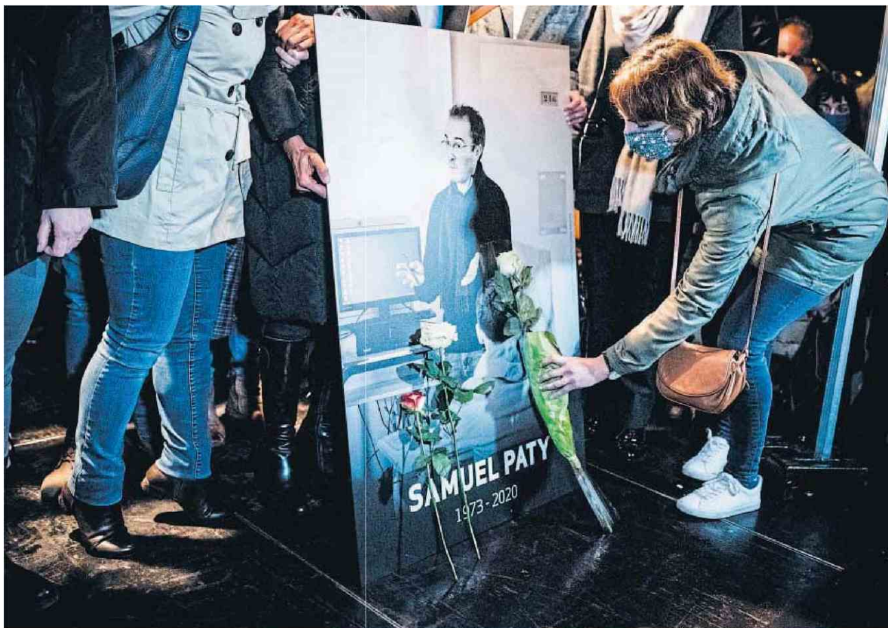
Conflans-Sainte-Honorine (Yvelines), le 20 octobre 2020. Près de 6 000 personnes rendaient hommage à Samuel Paty après son meurtre sauvage, devant le collège du Bois-d'Aulne où il exerçait.