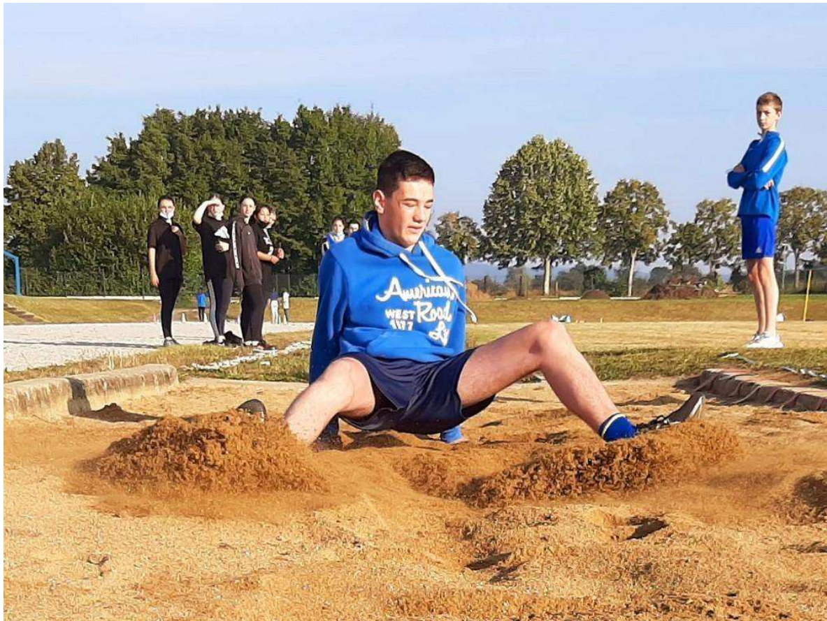
Belle prestation de saut en longueur.

Les compétences sollicitées préparent ainsi ces futurs étudiants à ce qui les attend l'an prochain. Le sport scolaire est formateur.