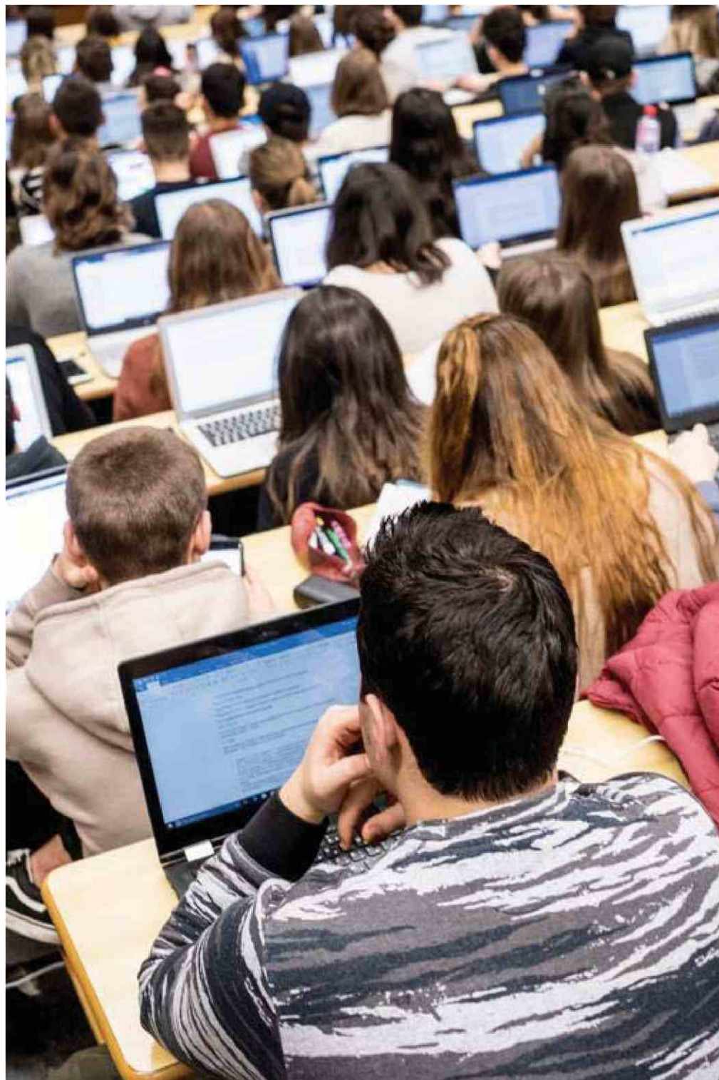
Dans les universités de Montpellier et Lyon, en 2020 et 2018.