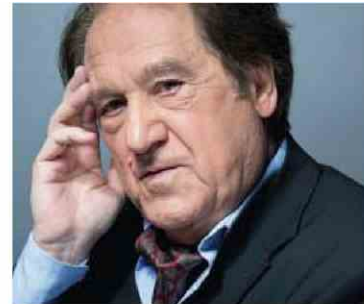
Jacques Julliard. Selon l'essayiste, la France vit « une crise intellectuelle ».

sachants, de brillants socio-pédagogues pour minimiser, rassurer, en tout cas pour claironner que le retour de l'école à ses missions d'instruction de base ne ferait qu'aggraver la situation. Tout récemment encore, une brochette de psychologues entreprenait de nous faire croire que c'est l'esprit de compétition qui est responsable du mauvais fonctionnement de l'école. Seigneur ! Dans le temps même où toute forme d'émulation a disparu des classes et où, année après année, les classements internationaux pointent du doigt le recul de l'école française par rapport aux pays étrangers, et cela aussi bien en ce qui concerne le français, les langues vivantes que les mathématiques ! A l'école du devoir, des leçons et de la recherche du résultat, on a substitué la bienveillance. Comme si la bienveillance, qui n'a jamais manqué aux hussards noirs de la République, pouvait se substituer à l'assiduité, au travail et à l'effort ! Décidément, l'Etat français est victime, depuis une trentaine d'années, d'une pédagogie béatifiante qui accumule