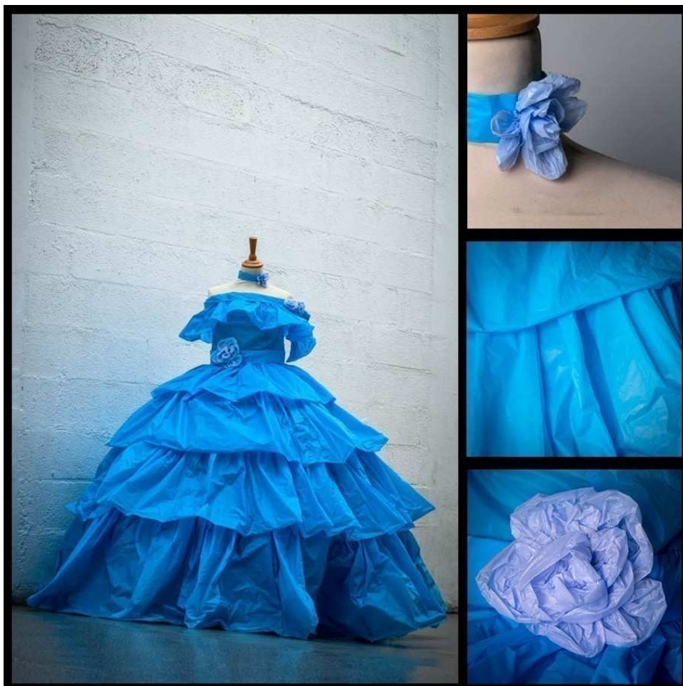
Robe Sissi réalisée par Laurine, une élève d'Arts Appliqués.

Les élèves auraient ensuite dû défiler avec leur création mais la pandémie de l'an dernier a contraint à l'annulation de l'événement. S'il n'est plus question de défiler en raison du départ des lycéens à travers la France pour leurs études supérieures, le projet continue. L'année prochaine, d'autres jeunes du lycée Laplace termineront la confection d'un décor commencé par la section menuiserie de l'établissement.