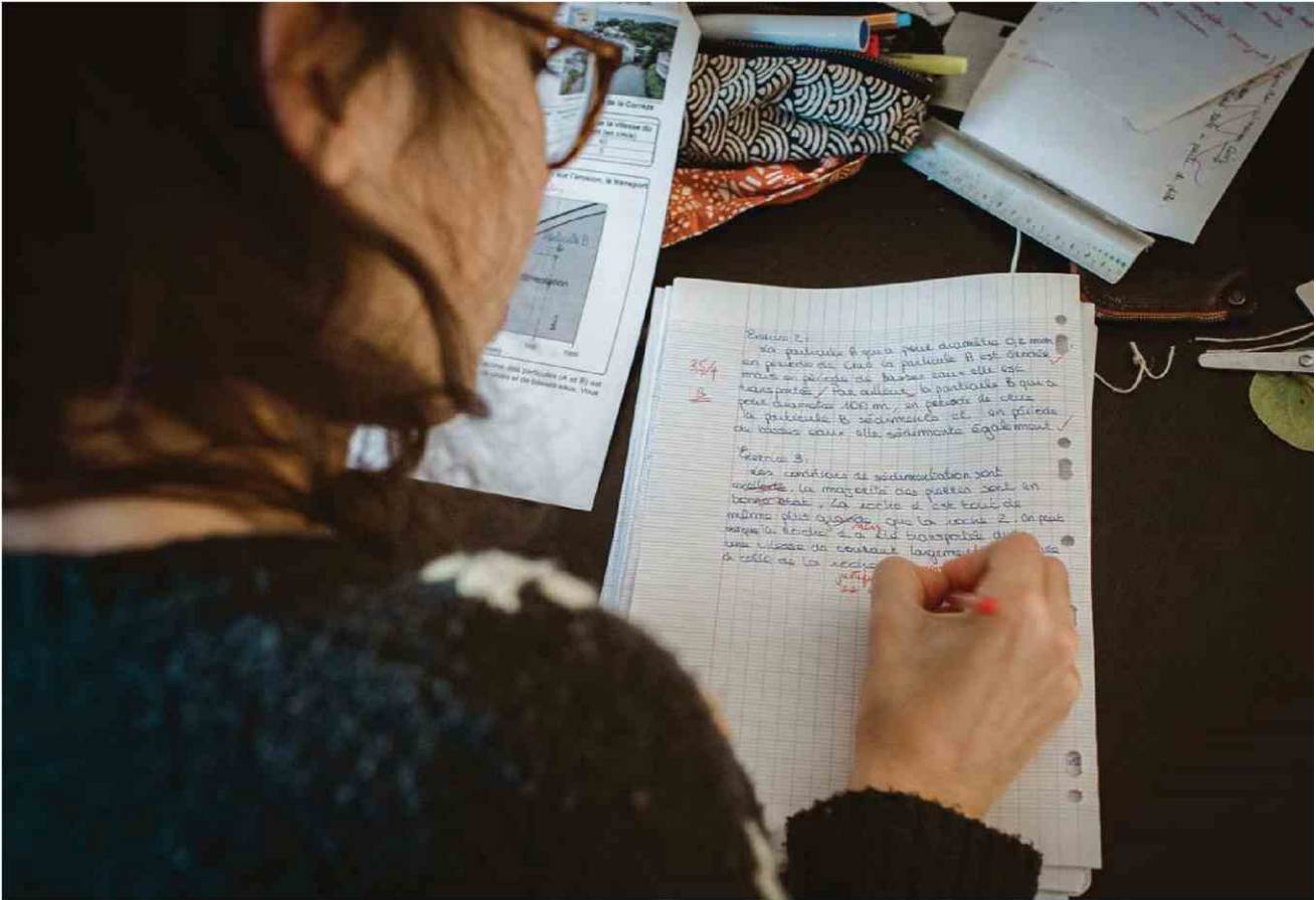
Les notes des élèves sont toutes relatives. D'autant qu'avec la pandémie, certains enseignants de lycée ont été tentés d'évaluer avec une particulière bienveillance.