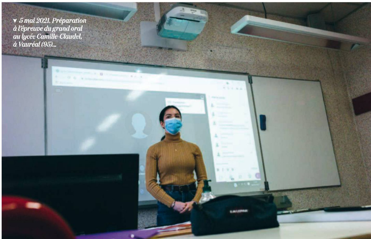
▼ 5 mai 2021. Préparation à l'épreuve du grand oral au lycée Camille-Claudel, à Vauréal (95)...