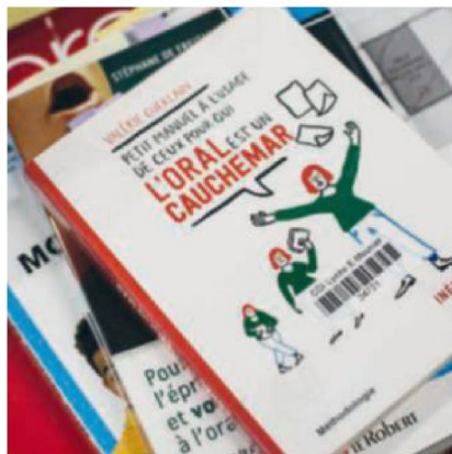
▲ Manuels de préparation au grand oral.

Ce sentiment, on l'a retrouvé chez pas mal d'enseignants. Approprié et bien préparé, le grand O a des vertus qui dépassent de loin le « simple » apprentissage de l'oralité. D'un côté, il incite les profs à s'intéresser au travail de leurs collègues (les questions pouvant être à cheval sur deux spécialités) ou à mettre en exergue les applications concrètes de leurs disciplines. De l'autre, il pousse les élèves à faire le lien entre leurs passions et leurs études (les surfeurs bossent sur les vagues, les rêveurs sur Pluton...), à mémoriser leurs cours de manière active, à développer leur esprit critique en s'évaluant les uns les autres. Bref, il instille un peu de cette « pédagogie active », pronée tant par les sciences de l'éducation que par les sciences du cerveau, dans un lycée français qui, jusqu'à présent, se démarque par son conservatisme.