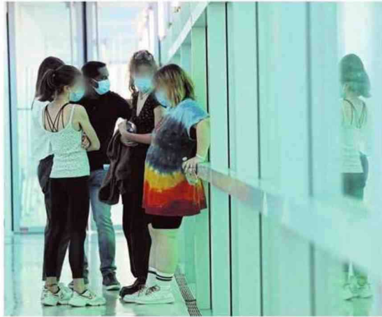
Chaque année, la Maison de Solenn voit passer 3 000 jeunes et leur famille qui viennent chercher un répit.