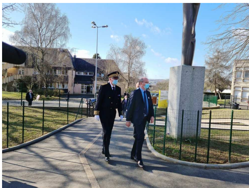
Arrivée de Jean-Michel Blanquer, au collège de Brécey. -

Le dispositif de police et de gendarmerie déployé pour la visite de Jean Castex était impressionnant ce vendredi matin à Brécey. Sauf qu'à 9 h 50, seul le ministre de l'Éducation nationale et sa secrétaire d'État en charge de l'éducation prioritaire, Nathalie Elimas, sont entrés dans le collège de la commune. En effet, Jean Castex a annulé sa venue à 22 h 30, jeudi 25 mars, parce qu'il devait rester à Paris pour gérer la crise sanitaire. Jean-Michel Blanquer et Nathalie Elimas ont donc visité le collège de Brécey dont l'internat est labellisé internat d'excellence. En marge de cette visite, une quarantaine de personnes, encadrées par un gros dispositif de sécurité, ont participé à une manifestation dans le calme à quelques centaines de mètres du collège. Ils voulaient dénoncer les fermetures de classes dans le 1 er et le second degré comme dans les écoles de Ger et Hudimesnil et au collège Chalmel Lacour d'Avranches. Une délégation de parents du collège voisin de Sourdeval, qui doit fermer à la rentrée, avait fait le déplacement également.