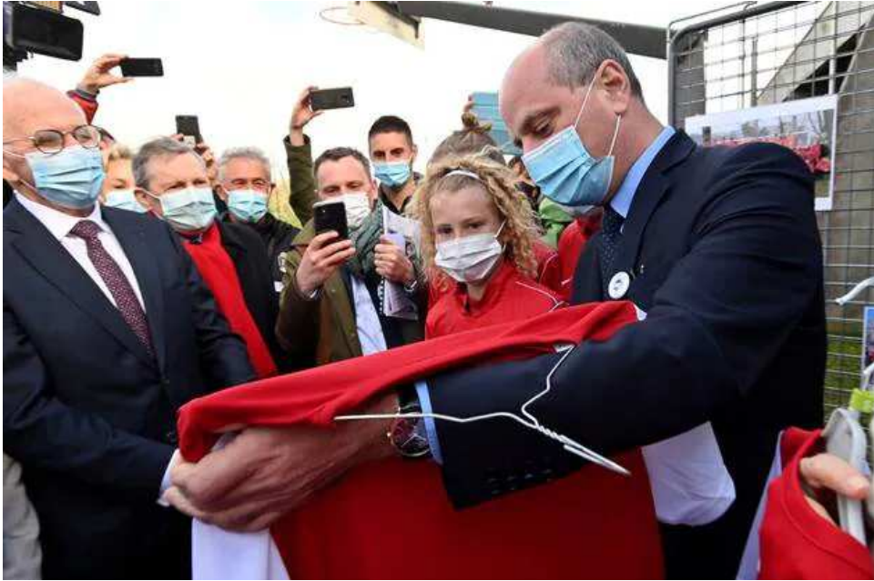
Un maillot aux couleurs de la section foot du collège pour le ministre.

est une ancienne de la section foot du collège. Aujourd'hui en BTS à Caen, elle est venue dire aux ministres qu'elle avait vécu «des super années au collège de Brécey ».