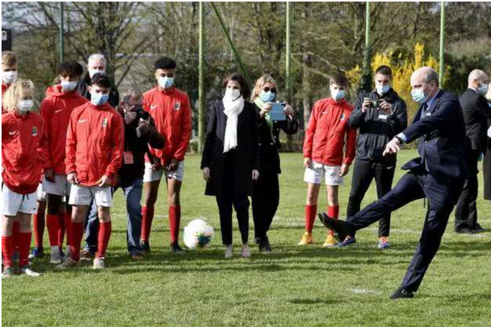
Avant la visite de l'internat, séance de tirs au but pour Jean-Michel Blanquer avec les jeunes de la section foot.

Quelques minutes plus tard, la délégation visite l'internat des filles. Une jeune collégienne présente les chambres et explique son parcours : «À la maison, j'avais du mal à faire mes devoirs. À l'internat, on est bien suivi et, aujourd'hui, mes parents sont très fiers.»