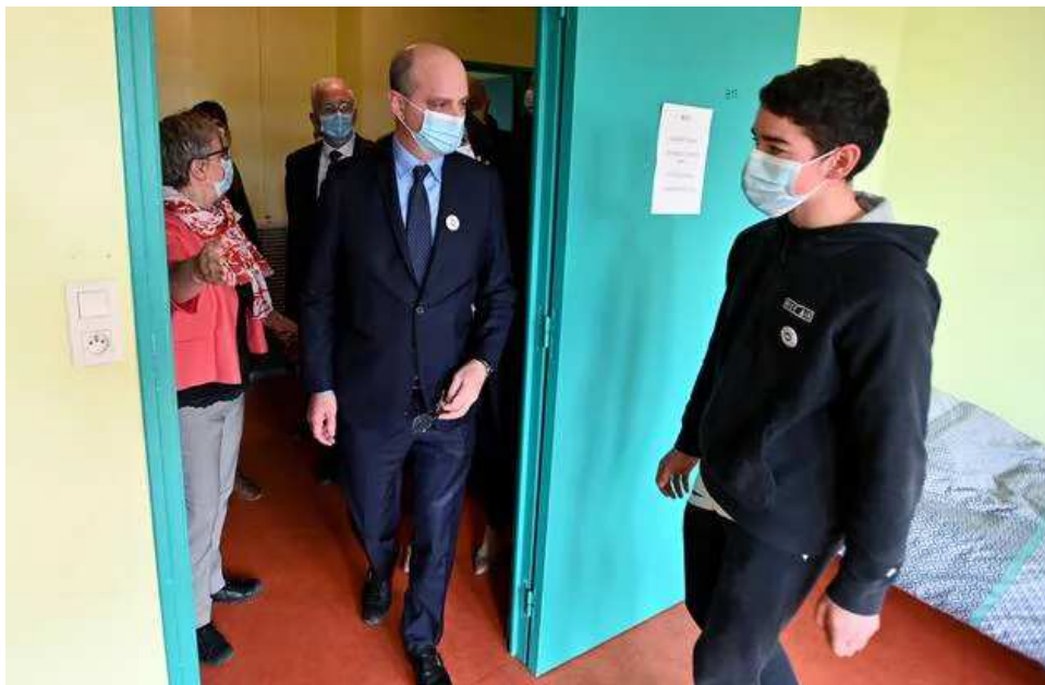
Visite des chambres de l'internat.