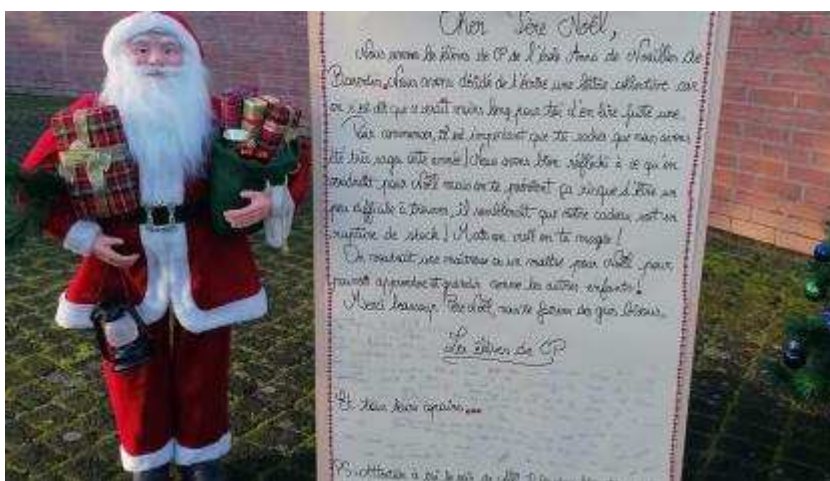
La lettre géante écrite par les élèves de CP de l'école Anna-de-Noailles.