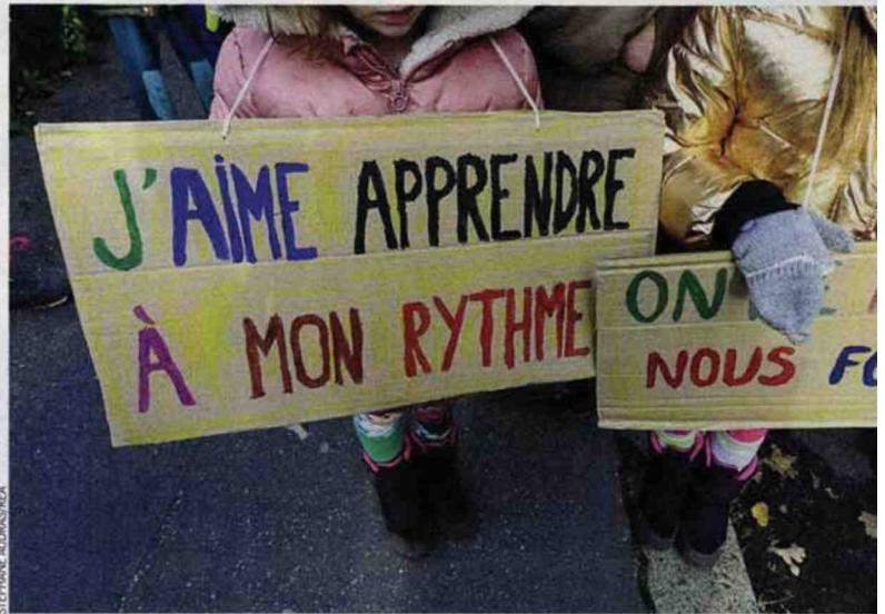
MANIFESTATION, à Lyon, contre le projet de loi rendant l'école obligatoire de 3 ans à 16 ans, le 9 décembre.

Faute de moyens, 72 % des familles seulement seraient contrôlées. « Je suis d'accord avec Gérard Darmanin : les petits fantômes de la république ne devraient pas exister. Mais la raison est un défaut de fonctionnement du dispositif de contrôle étatique et non de l'IEF !