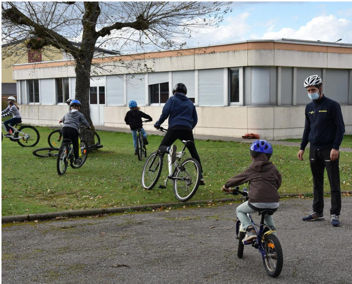
Session vélo mercredi 21 octobre dans l'après-midi pour les enfants avec une intervention de la préfecture de l'Eure.