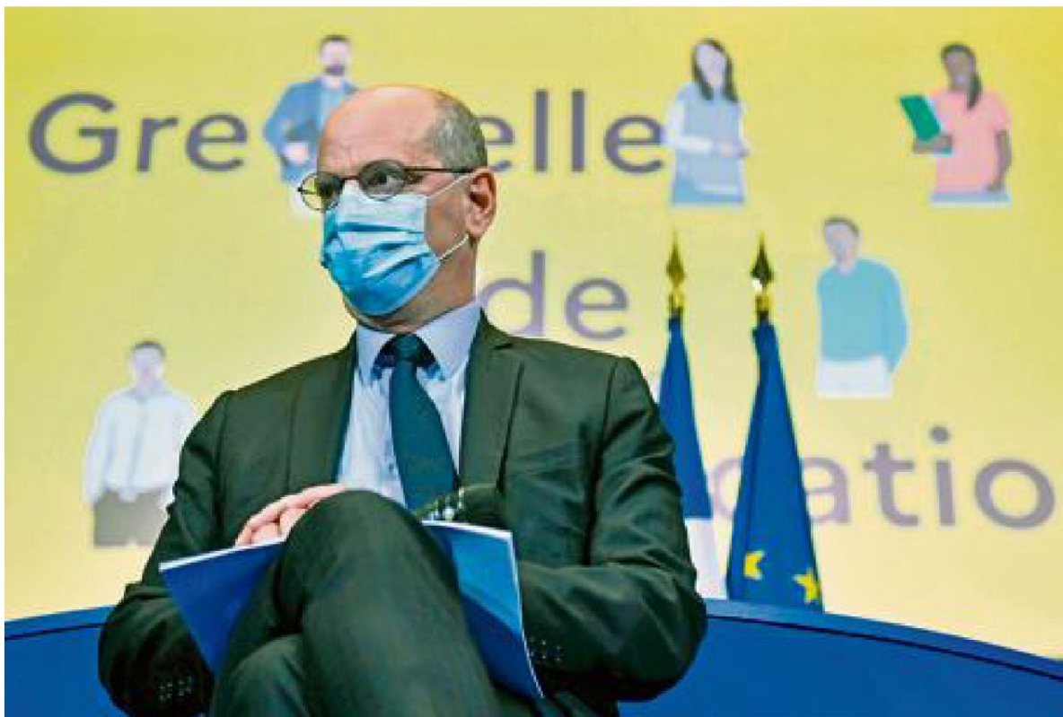
Jean-Michel Blanquer, lors du Grenelle de l'éducation, à Paris, le 22 octobre.