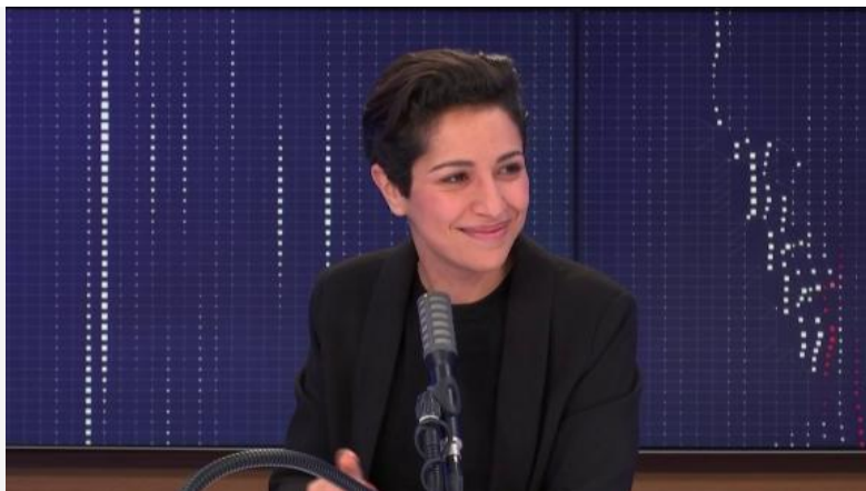
Sarah El Haïry, secrétaire d'État chargée de la Jeunesse et de l'Engagement était l'invité du "8h30 franceinfo", lundi 19 octobre 2020.