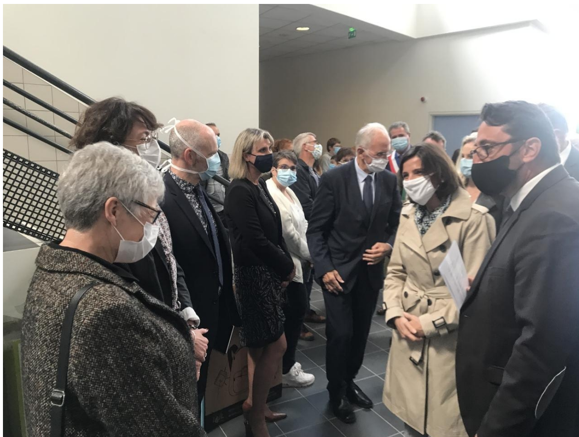
Nathalie Élimas en visite au collège Le Farage de Périers.

En visite dans la Manche ce jeudi 1er octobre 2020, au collège Le Fairage, à Périers (Manche) , la secrétaire d'État Nathalie Élimas rencontre les équipes pédagogiques engagées dans le dispositif « Devoirs faits à distance ».