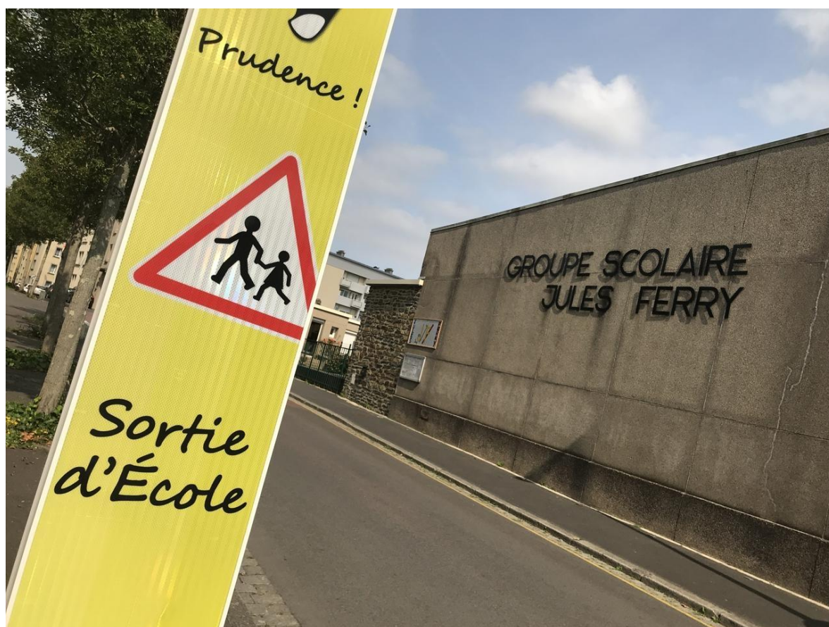
Une agente de restauration et d'entretien a été testée positif au Covid à la rentrée à l'école Jules-Ferry. Ouest-France

La CPAM (Caisse primaire d'assurance maladie) a contacté le service éducation « pour savoir avec qui cette dame avait pu être en contact le jour de la rentrée scolaire. Quatre autres agents étaient concernés. Elle n'était pas en contact direct avec les élèves car respectant les règles de distanciation et les gestes barrières en leur présence », confirme Clément Nignol.