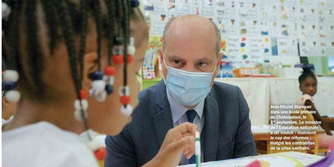
Jean-Michel Blanquer dans une école primaire de Châteauroux, le 1 er septembre. Le ministre de l'Éducation nationale a dit vouloir « maintenir le cap des réformes » malgré les contraintes de la crise sanitaire.